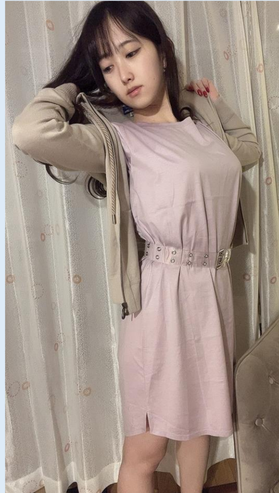
※コーディネートイメージ