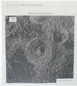
電子顕微鏡写真 300 nm