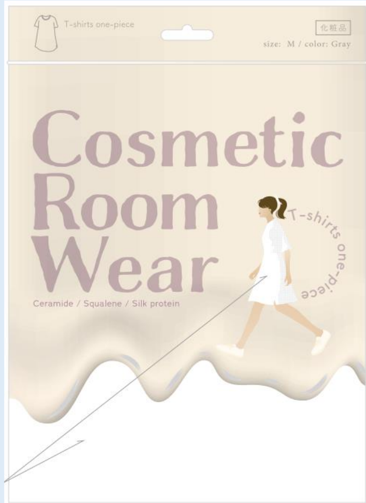
※パッケージイメージ