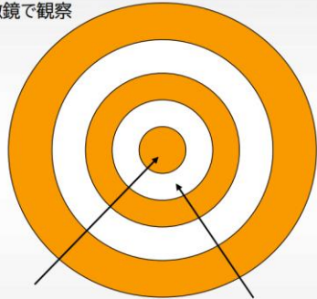
油層 (セラミド、スクワランオイル ウンデシレン酸モノグリセリド) 水層 (シルクプロテイン)